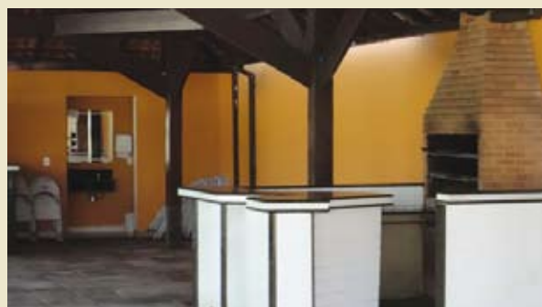
Reformas das Churrasqueiras I e II