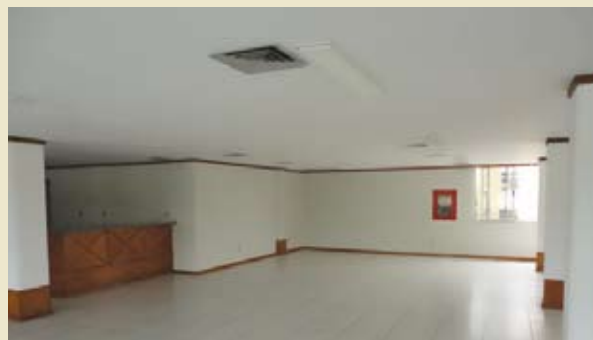
Pintura do Salão de Festas