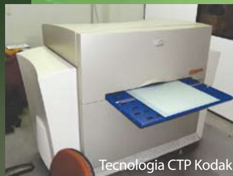
Tecnologia CTP Kodak

A preservação do meio ambiente é uma prioridade para a Gráfica e Editora Ano Bom, que atualmente utiliza a tecnologia CTP Kodak, cuja chapa digital não utiliza qualquer processo químico e dispensa o uso de processadora, revelador ou produtos químicos, tornando o processo menos impactante para o meio ambiente. Essa metodologia apresenta ainda outras vantagens como: não consumir água e suportar tiragens de até 100 mil impressos, entre outras.