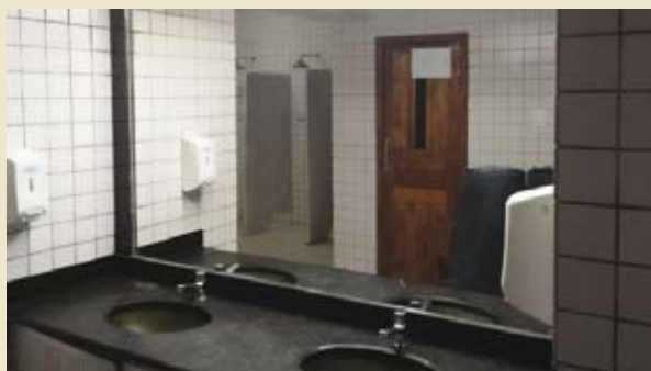
Reforma e Modernização da Sauna